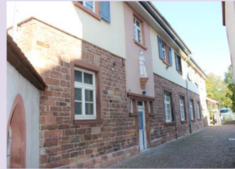
Mutter-Kind Haus Mörlenbach