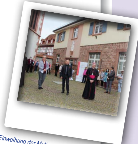
Einweihung der Mutter-Kind-Wohngruppe im Jahr 2020