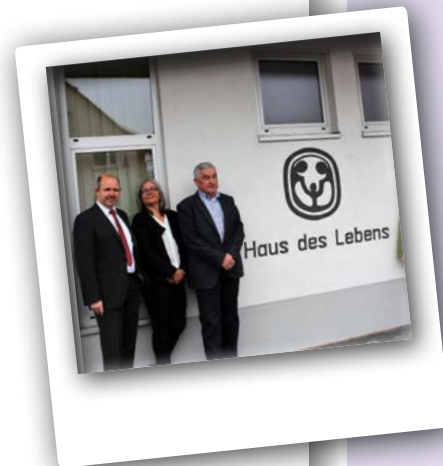
Übernahme der Trägerschaft Haus des Lebens

Im Jahr 2019 wurde die Einrichtung in die Dienststelle Kinder- und Jugendhilfe übergeleitet. Zu dem Zeitpunkt war bereits eine weitere stationäre Einrichtung der Jugendhilfe in Mörlenbach in Planung. Im Rahmen der Bedarfserhebung und Konzeptarbeit wurde entschieden, eine Mutter-Kind-Einrichtung aufzubauen, die im September 2020 von Bischof Kohlgraf eingeweiht werden konnte. Im Jahr 2021 kam die Übernahme der Trägerschaft des „Haus des Lebens“ in Viernheim hinzu, wofür ein ambulantes Nachbetreuungs- und Sozialpädagogische Familienhilfe (SPFH) Angebot entwickelt wurde. Seit 2022 werden Frauen, die aus der Mutter-Kind-Einrichtung in die Verselbständigung gezogen sind, von einer Sozialpädagogin nachbetreut. Die Dienststelle wächst sukzessive sowohl was die bedarfsgerechten Angebote als auch, was die Anzahl der Mitarbeitenden angeht.