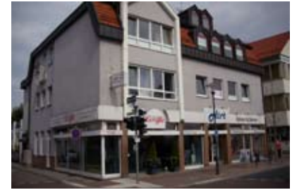
Caritasbüro Pfungstadt Waldstraße 39 64319 Pfungstadt Tel: 0 61 57 - 40 10 gpz.pfungstadt@caritas-darmstadt.de