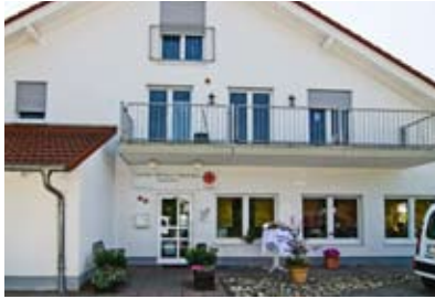
Gemeindepshychiatrisches Zentrum Reinheim Darmstädter Straße 55 64354 Reinheim Tel: 0 61 62 - 80 98 50 gpz.reinheim@caritas-dieburg.de