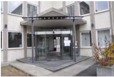
Gemeindepshychiatrisches Zentrum Darmstadt Wilhelminenplatz 7 64283 Darmstadt Tel: 0 61 51 - 60 96 0 gpz@caritas-darmstadt.de