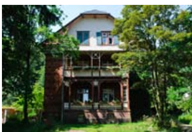
Wohnheim Haus Elim Alte Darmstädter Straße 9 64367 Mühlthal-Trautheim Tel: 0 61 51 - 60 66 0 haus.elim@caritas-darmstadt.de