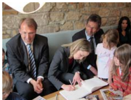
Familienministerin Kristina Schröder lobte das Caritaszentrum als eine lebendige Begegnungsstätte aller Generationen und nahm 2012 das Haus in das Folgeprogramm der Bundesregierung auf.

Caritaszentrum Franziskushaus Klostergasse 5 a, 64625 Bensheim Tel.: 06251 85425-0