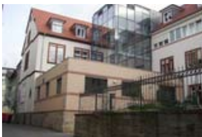
Caritas Zentrum Franziskushaus Klosterstraße 5 a 64625 Bensheim Tel: 0 62 51 - 8 54 25 0 franziskushaus@caritas-bergstrasse.de