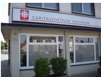
Gemeindepshychiatrisches Zentrum Griesheim Wilhelm-Leuschner-Straße 101 64347 Griesheim Tel: 0 61 55 - 86 83 77 0 gpz.griesheim@caritas-darmstadt.de