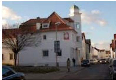
Gemeindepshychiatrisches Zentrum Bergstrasse-Ried Neue Schulstr. 16 68623 Lampertheim Tel: 0 62 06 - 59 23 2 gpz-ried@caritas-bergstrasse.de